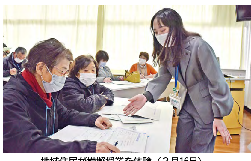
地域住民が模擬授業を体験 (2月16日)